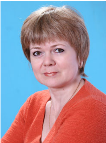
Образование - сред.- спец. (КПУ)